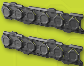
2 rails muraux RSL2WR-2