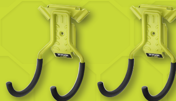
2 crochets double simple RSLW805