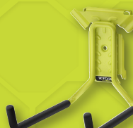
1 crochet double Long RSLW803