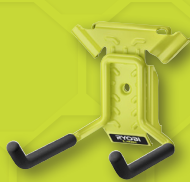
1 crochet double RSLW801