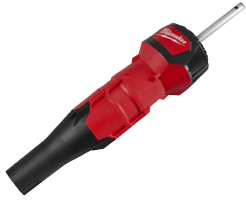
Accessoire souffleur QUIK-LOK™ M18 FOPH-BA