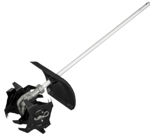
Accessoire sarcluse QUIK-LOK™ M18 FOPH-CA