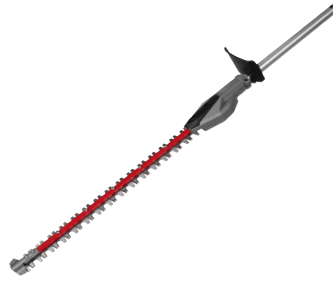
Accessoire taille-haies fixe QUIK-LOK™ M18 FOPH-SHTA